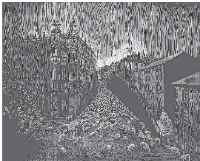
Eine vom Mond gespenstisch beleuchtete Schaflawine ergiesst sich die Rämistrasse hinunter.