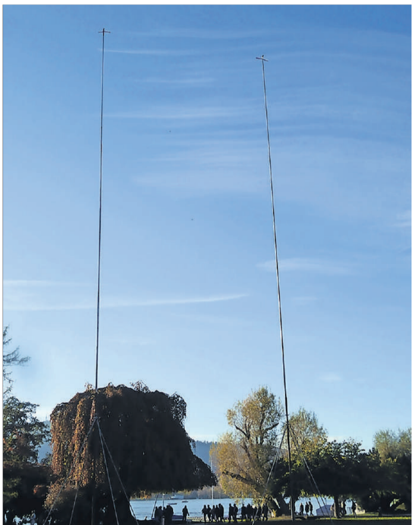
Die Szenerie am Zürichhorn: Auf der Blatterwiese soll eine Seilbahnstation (30 Meter hoch) gebaut werden. Dazu kommt ein Seilbahnmast von 88 Meter Höhe im Seeufer.