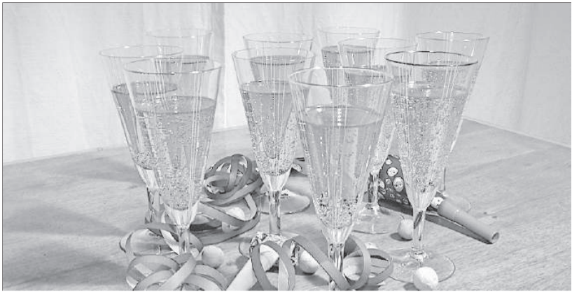
Am 4. Januar stossen die Witiker auf 2019 an.